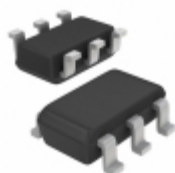
ZXMN2A01E6TA Diodes Incorporated MOSFET N-CH 20V 2.44 A SOT-23-6