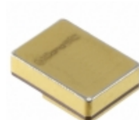
1N8033-GA GeneSiC Semiconductor DIODE SCHOTTKY 650V 4.3A TO276