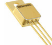
1N8028-GA GeneSiC Semiconductor DIODE SCHOTTKY 1.2KV 9.4A TO257