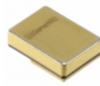
1N8031-GA GeneSiC Semiconductor DIODE SCHOTTKY 650V 1A TO276