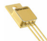
1N8028-GA GeneSiC Semiconductor DIODE SCHOTTKY 1.2KV 9.4A TO257