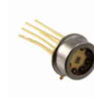
MTMD6894T38 Marktech Optoelectronics EMITTER IR UV MULTI-NM TO-5-8