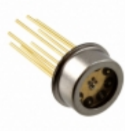
MTMD6891T38 Marktech Optoelectronics EMITTER IR MULTI-NM 100MA TO-5-8