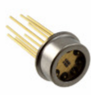
MTMD7885T38 Marktech Optoelectronics EMITTER IR MULTI-NM 100MA TO-5-8