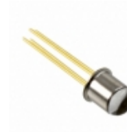
MTMD7885NN24 Marktech Optoelectronics EMITTER IR MULTI-NM 100MA RADIAL