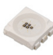
MTMD6788594SMT6 Marktech Optoelectronics EMITTER IR VIS MULTI-NM 80MA SMD