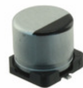
EEE-FT1C221AP Panasonic Electronic Components CAP ALUM 220UF 20% 16V SMD