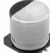
EEE-FT1C102GP Panasonic Electronic Components CAP ALUM 1000UF 20% 16V SMD