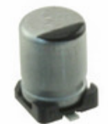
EEE-FT1C470AR Panasonic Electronic Components CAP ALUM 47UF 20% 16V SMD