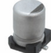
EEE-FT1C101AR Panasonic Electronic Components CAP ALUM 100UF 20% 16V SMD