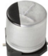
EEE-FT1C122UP Panasonic CAP ALUM 1200UF 20% 16V SMD