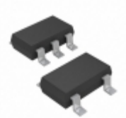
MIC5232-2.5YD5-TR Microchip Technology IC REG LDO 2.5V 10MA TSOT23-5