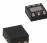
MIC5232-1.2YML-TR Microchip Technology IC REG LDO 1.2V 10MA 6MLF