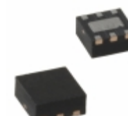
MIC5232-2.5YML-TR Microchip Technology IC REG LDO 2.5V 10MA 6MLF