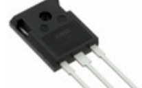
IXFH52N30Q IXYS MOSFET N-CH 300V 52A TO-247AD