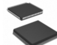
AT40K20-2CQI Microchip Technology IC FPGA 20K GATES 160QFP