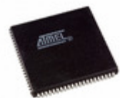
AT40K20AL-1AJC Microchip Technology IC FPGA 20K GATES 84PLCC