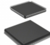
AT40K20-2EQC Microchip Technology IC FPGA 193 I/O 240QFP