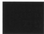
IXDD514D1 IXYS IC GATE DRIVER 14A LO SIDE 6-DFN