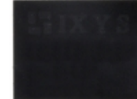
IXDD509D1 IXYS IC GATE DRIVER ULT FAST 9A 6-DFN