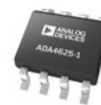
ADA4625-1ARDZ ADI (Analog Devices, Inc.) SINGLE LOW NOISE, FAST SETTLING,