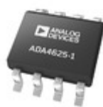
ADA4625-1ARDZ-R7 ADI (Analog Devices, Inc.) SINGLE LOW NOISE, FAST SETTLING,