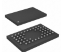
SST39VF401C-70-4I-MAQE-T Microchip Technology IC FLASH 4MBIT 70NS 48WFBGA