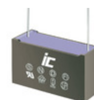
MPX685K305N Illinois Capacitor CAP FILM 6.8UF 10% 305VAC RAD