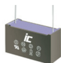
MPX684K305E Illinois Capacitor CAP FILM 0.68UF 10% 305VAC RAD