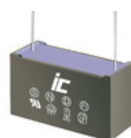
MPX823K305D Illinois Capacitor CAP FILM 0.082UF 10% 305VAC RAD