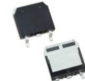
IXFT12N100F IXYS MOSFET N-CH 1KV 12A TO268