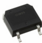
IXFT120N30X3HV IXYS Corporation 300V/120A ULTRA JUNCTION X3-CLAS