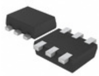
EMH10T2R Rohm Semiconductor TRANS 2NPN PREBIAS 0.15W EMT6