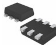
EMH10FHAT2R LAPIS Semiconductor NPN+NPN DIGITAL TRANSISTOR (CORR