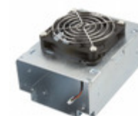
EMH TF KIT XP Power COVER/FAN ASSY FOR EMH PWR SUPP