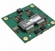
EMH-54/3-Q48N-C Murata Power Solutions Inc. DC-DC CONVERTER 18-72VIN 54V OUT