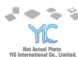
MB90F949APQC FUJI MB90F949APQC FUJI