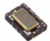
T604-040.0M Connor-Winfield OSC VCTCXO 40.000MHZ LVCMOS SMD