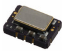
T604-030.72M Connor-Winfield OSC VCTCXO 30.72 MHZ LVCMOS SMD