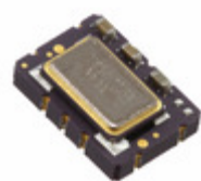
T604-020.0M Connor-Winfield OSC VCTCXO 20.000MHZ LVCMOS SMD