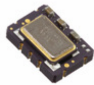
T604-025.0M Connor-Winfield OSC VCTCXO 25.000MHZ LVCMOS SMD