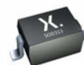
PDZ22BZ Nexperia DIODE ZENER 22.47V SOD323