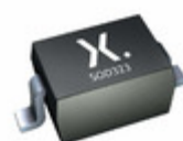
PDZ20BZ Nexperia DIODE ZENER 20.39V SOD323