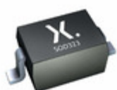
PDZ20BGWJ Nexperia PDZ20BGWSOD123SOD2