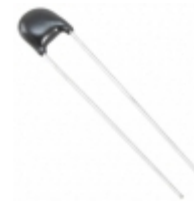
ERZ-E05A201 Panasonic Electronic Components VARISTOR 200V 1.2KA DISC 7MM