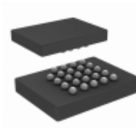
S25FL512SAGBHV13 Cypress Semiconductor IC FLASH 512M SPI 133MHZ 24BGA