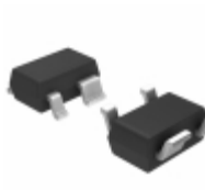
S-1009N29I-N4T1U SII Semiconductor Corporation VOLTAGE SUPERVISORY