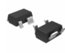
S-1009N27I-N4T1U SII Semiconductor Corporation VOLTAGE SUPERVISORY