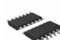
M74HC51RM13TR STMicroelectronics IC INVERTER GATE DUAL 14- SOIC