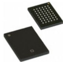
CY62167EV30LL-45BVXI Cypress Semiconductor Corp IC SRAM 16MBIT 45NS 48VFBGA