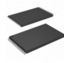
CY62167EV30LL-45ZXIT Cypress Semiconductor Corp IC SRAM 16MBIT 45NS 48TSOP