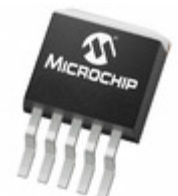
MCP1826T-ADJE/ET Microchip Technology IC REG LDO ADJ 1A DDPAK