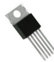
MCP1827-1202E/AT Microchip Technology IC REG LDO 1.2V 1.5A TO220-5