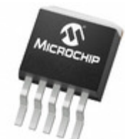
MCP1826T-5002E/ET Microchip Technology IC REG LDO 5V 1A DDPAK