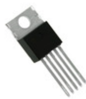
MCP1827-0802E/AT Microchip Technology IC REG LDO 0.8V 1.5A TO220-5