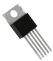
MCP1827-1802E/AT Microchip Technology IC REG LDO 1.8V 1.5A TO220-5