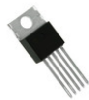
MCP1827-2502E/AT Microchip Technology IC REG LDO 2.5V 1.5A TO220-5