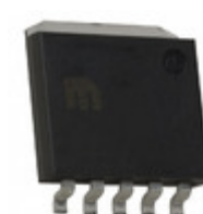
MIC37302BR Microchip Technology IC REG LDO ADJ 3A SPAK-5