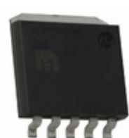
MIC37301-3.3BR Microchip Technology IC REG LDO 3.3V 3A SPAK-5