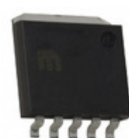
MIC37301-2.5WR-TR Microchip Technology IC REG LDO 2.5V 3A SPAK-5