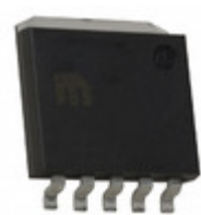
MIC37301-3.3WR-TR Microchip Technology IC REG LDO 3.3V 3A SPAK-5