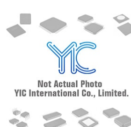
MIC37301-3.3WRTR MICREL MICREL TO263-5