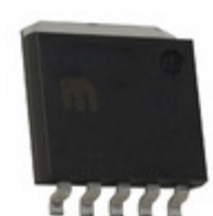
MIC37301-3.3BR TR Microchip Technology IC REG LDO 3.3V 3A SPAK-5