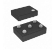
AD8605ACBZ-REEL Analog Devices Inc. IC OPAMP GP 10MHZ RRO 5WLCSP