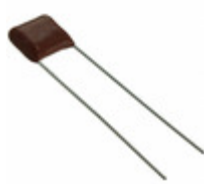
ECQ-E6152JF Panasonic Electronic Components CAP FILM 1500PF 5% 630VDC RADIAL