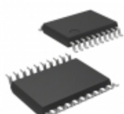
MIC2596-2BTS Microchip Technology IC SWITCH HOT SWAP DUAL 20-TSSOP