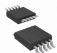
MCP4242T-502E/UN Microchip Technology IC RHEOSTAT 5K 2CH 10MSOP