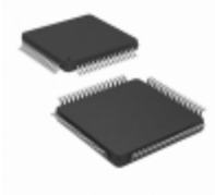
PIC17LC752T-08I/PT Microchip Technology IC MCU 8BIT 16KB OTP 64TQFP