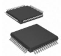
AD5363BSTZ Analog Devices Inc. IC DAC 14BIT 8CH SERIAL 52-LQFP