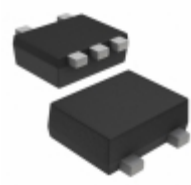
DMA961040R Panasonic TRANS PREBIAS DUAL PNP SSMINI5