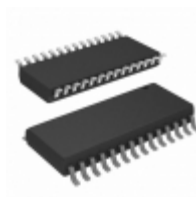
AT28C17E-20SI Microchip Technology IC EEPROM 16KBIT 200NS 28SOIC