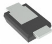
TDZVTR6.8 LAPIS Semiconductor ZENER DIODE