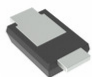
TDZVTR20 LAPIS Semiconductor SMALL MOLD TYPE ZENER DIODE FOR