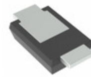
TDZVTR30 LAPIS Semiconductor SMALL MOLD TYPE ZENER DIODE FOR