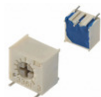
3361S-1-201G Bourns, Inc. TRIMMER 200 OHM 0.5W GW SIDE ADJ