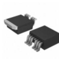
IXTA160N10T7 IXYS MOSFET N-CH 100V 160A TO-263-7