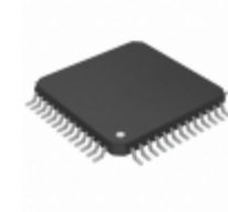
CY7C136-25NXC Cypress Semiconductor Corp IC SRAM 16KBIT 25NS 52QFP