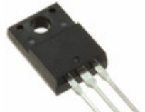
SDURF2030CTR SMC Diode Solutions DIODE ARRAY GP 300V ITO220AB