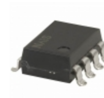
AQW612EHA Panasonic RELAY OPTO AC/DC 60V 500MA 8SMD