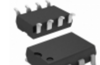
AQW610S Panasonic RELAY OPTO AC/DC 350V 100MA 8SOP