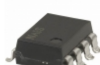
AQW610EHAZ Panasonic RELAY OPTO DPST-NO/NC 120MA 350V