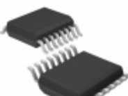
LTC4223CGN-2#PBF Linear Technology IC CNTRLR HOT SWAP DUAL 16-SSOP