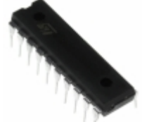
E-L4981A STMicroelectronics IC PWR FACTOR CORRECTOR 20-DIP