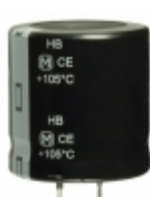
ECO-S2GB181DA Panasonic Electronic Components CAP ALUM 180UF 20% 400V SNAP