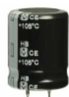
ECO-S2GB121CA Panasonic Electronic Components CAP ALUM 120UF 20% 400V SNAP