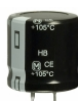
ECO-S2GB101CA Panasonic Electronic Components CAP ALUM 100UF 20% 400V SNAP