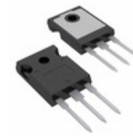
IRG7PH44K10DPBF Infineon Technologies IGBT 1200V 70A 320W TO247AC