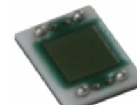
CL1L5AT006L-T1 Susumu IND DELAY LINE 60PS 3 OHM SMD