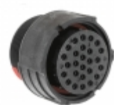
CL1F4103 Souriau Connection Technology CONN HSG PLUG 26POS INLINE SKT