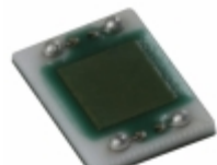
CL1L5AT012L-T1 Susumu IND DELAY LINE 120PS 3 OHM SMD