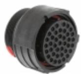
CL1F4200 Souriau Connection Technology CONN HSG PLUG 40POS INLINE SKT