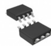
ST3485EBDR STMicroelectronics IC TXRX 3.3V RS485/422 8 SOIC