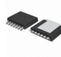
BA30E00WHFP-TR Rohm Semiconductor IC REG LDO 3.3V/ADJ 0.6A HRP7