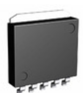
BA30DD0WHFP-TR Rohm Semiconductor IC REG LDO 3V 2A HRP