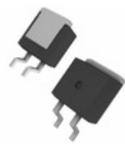
DSS16-01AS IXYS DIODE SCHOTTKY 100V 16A TO263AB