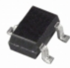
ADM1818-10AKSZ-RL7 Analog Devices Inc. IC MONITOR RESET 2.88V SC-70-3