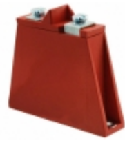
V481BA60 Littelfuse Inc. VARISTOR 750V 70KA CHASSIS