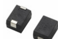
V480SM7 Littelfuse Inc. VARISTOR 747.5V 1.2KA 2SMD JLEAD