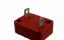
V481DB40 Littelfuse Inc. VARISTOR 750V 40KA BLADE ENCASED