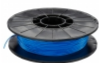
2563 Adafruit FILAMENT BLUE TPE 0.07" 500G