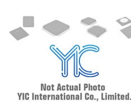
BTA204S-600D NXP BTA204S-600D NXP