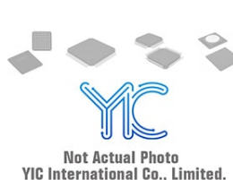
BTA204-800E NXP BTA204-800E NXP