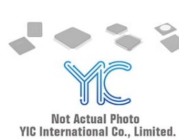
BTA204-800C PHILIPS BTA204-800C PHILIPS