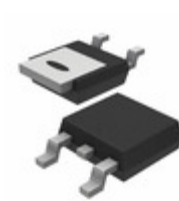
BTA204S-1000C,118 WeEn Semiconductors Co., Ltd TRIAC 1KV 4A DPAK