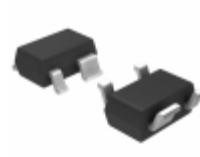
S-1000C45-N4T1U SII Semiconductor Corporation IC VOLT DETECTOR